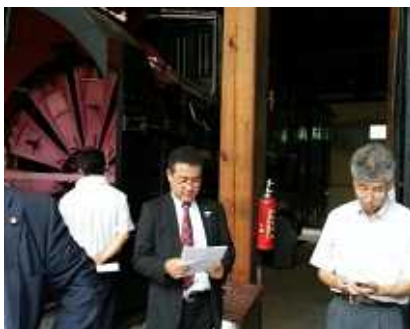
全国若手市議会議員の会で研修中