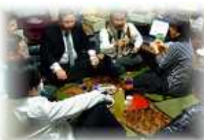
市政報告会の様子

定例街頭演説 毎週金曜日 (AM7:30 ~ 市民の森下交差点) 市政報告会 第2水曜日 (PM7:00 ~ 8:00) * 出張等で曜日が変更になることがあります