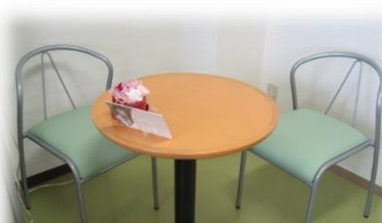
ケアプランサービス 山陽寿荘