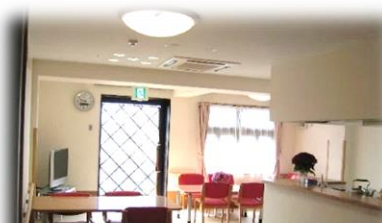
ショートステイ 山陽寿荘