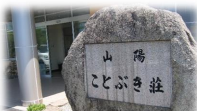
特別養護老人ホーム 山陽寿荘

※介護職員処遇改善加算Ⅰ・介護職員等特定処遇改善加算Ⅰ：それぞれ1月の総サービス費に5.9%、1.2%を乗じた額